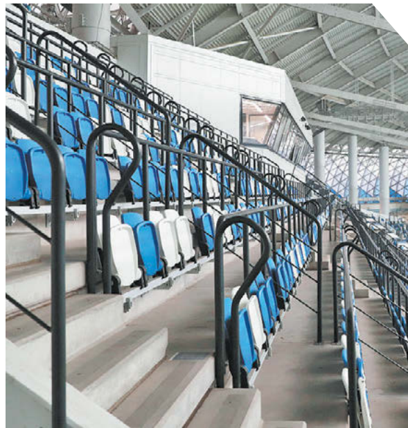
Федор Успенский «СЭ» / Canon EOS-1DX Mark II