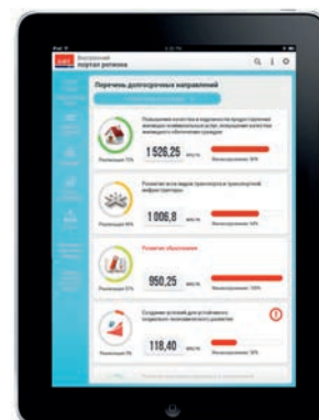
Мобильное приложение содержит все разделы стандартной версии Внутреннего портала

Онлайн-управление регионом и муниципалитетом!