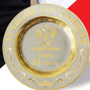
КОМПАНИЯ БФТ – «ЛУЧШИЙ ПОСТАВЩИК в сфере информационных технологий 2014»