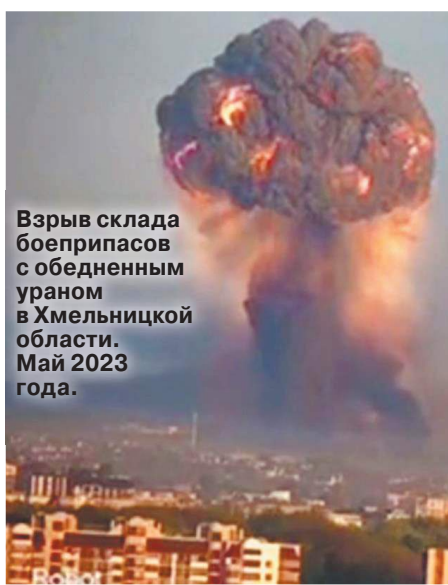
Взрыв склада боеприпасов с обедненным ураном в Хмельницкой области. Май 2023 года.