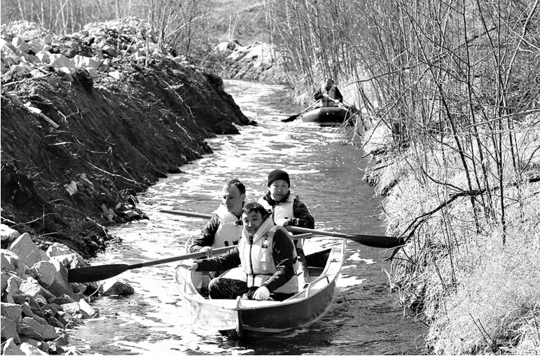
Местами канал чуть шире лодки, но участники сплава считают, что этого достаточно для стока лишней воды.

мы озер, должен отводить излишки воды из Якутска. Однако на долгие десятилетия его забросили. В результате протоки заилились, вода начала застаиваться, а в городе стало появляться все больше болот. Работы по восстановлению проточности были начаты в 2013 году. Сейчас они ведутся на так называемом малом кольце. Это часть канала, которая проходит непосредственно через город. После того как завершится обновление внутренних участков, основной фронт работ переместится на русло, по которому вода должна стекать в реку Лена в обход Якутска. Владимир Талюрский, Якутск