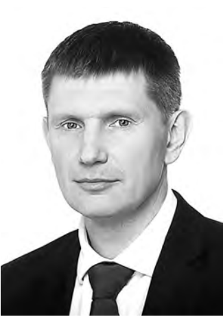
Максим Решетников, министр экономического развития Российской Федерации:

— По данным Минсельхоза на 7 октября, картофеля собрано меньше на 19 процентов, овощей — на семь процентов. Основная причина — низкие темпы уборки из-за погоды, а также нехватка рабочей силы в условиях карантинных ограничений. Как следствие — нетипичное подорожание овощей и фруктов. В сентябре цены на плоды и овощи выросли на 1,8 процента по отношению к августу, в то время как в 2017 — 2020 году их среднее снижение составляло 6,5 процента. С 1998 года в сентябре дефляция по овощам не наблюдалась лишь однажды, в 2010 году.