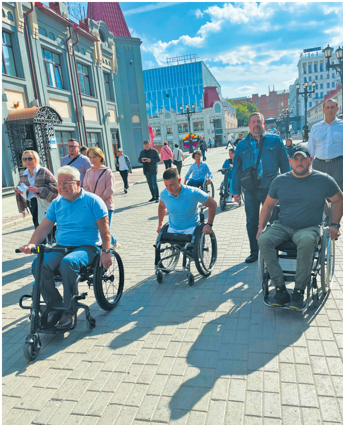
СПЧ ПРИ ГЛАВЕ РБ

— Через два года мы будем отмечать юбилей города, хотелось бы, чтобы наш город был удобным для жителей и гостеприимным для приезжих. Мы уже проецируем эту ситуацию, когда гость — человек на коляске — приехал в наш город, разместился в од-