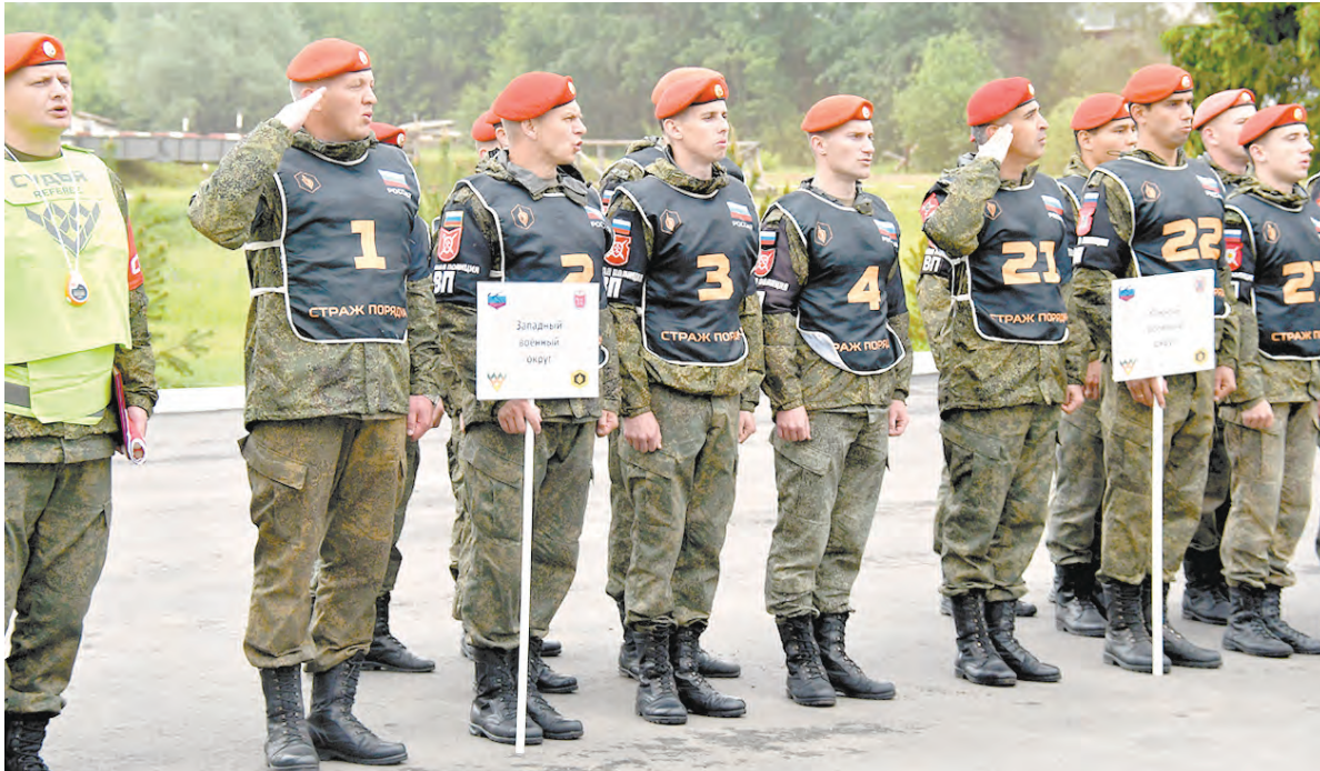
Команда ЗВО в готовности к началу состязаний

Наиболее интересным и сложным испытанием на этом этапе конкурса стала командная гонка, где военнослужащие показали свою выносливость и физическую силу на дистанции, оборудованной различными естественными и искусственными пре-