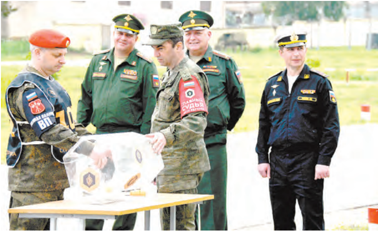
Идёт жеребьёвка очередности выступления команд

Московская обл.