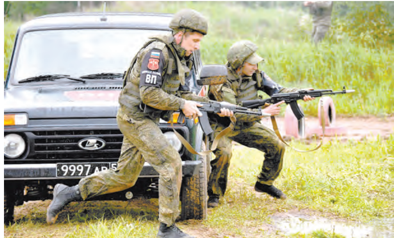
Работает военная полиция!