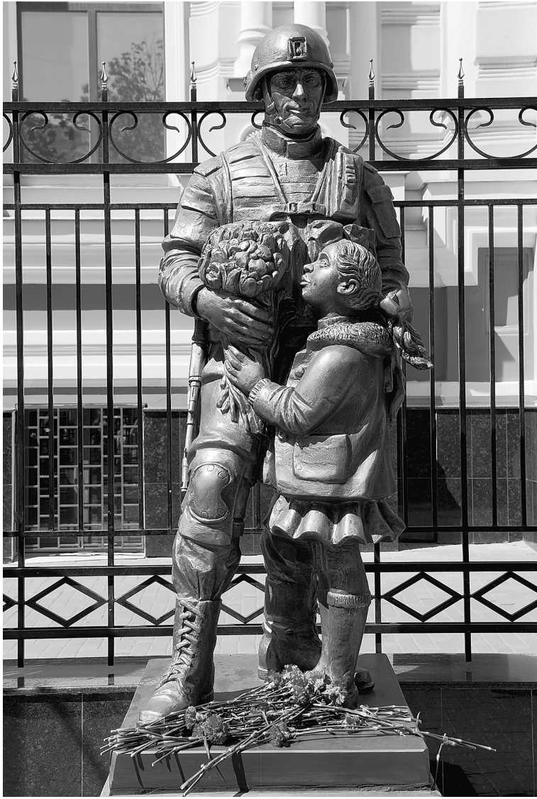
Такой же памятник вскоре появится в Ижевске возле Дворца детского и юношеского творчества.