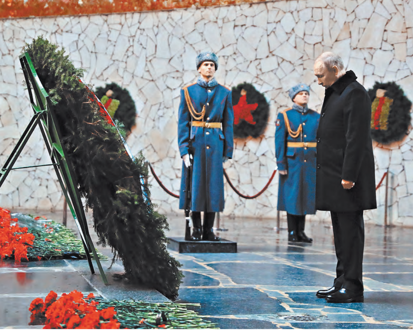
Владимир Путин во время возложения венка к Вечному огню в Зале воинской славы в музее-заповеднике «Сталинградская битва» на Мамеевом кургане.

войны маршал командовал 62-й армией, которая прославилась героической шестимесячной обороной Сталинграда. Волгоград эту важную дату отметил масштабно: более 250 мероприятий было посвящено этому событию. День в городе начался с парада, в котором приняло участие более полутора тысяч человек.