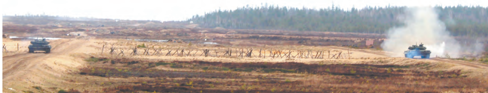
Огонь на танковой директрисе ведут на предельных дальностях

Контрольная проверка продолжается, десятки офицеров, входящих в экзаменационные комиссии, ответственно относятся к своим обязанностям.