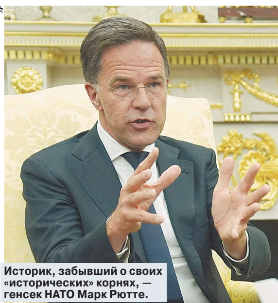
Историк, забывший о своих «исторических» корнях, — генсек НАТО Марк Рютте.