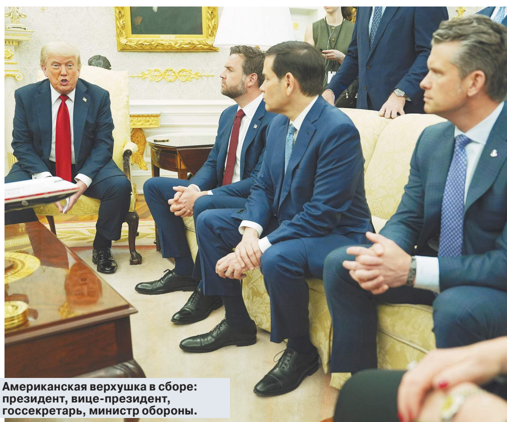
Американская верхушка в сборе: президент, вице-президент, госсекретарь, министр обороны.

Жители Воронежа рассказали об атаке украинских БПЛА