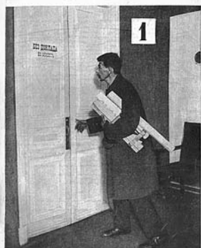
ДВЕРИ ДОЛЖНЫ РАСПЯХИВАТЬСЯ!