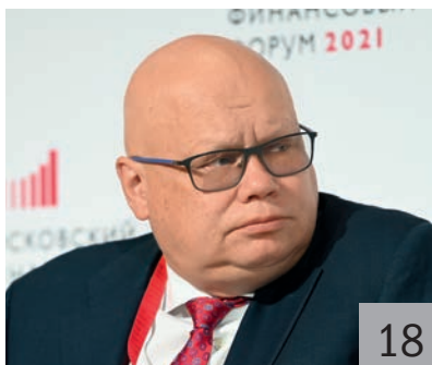
А. М. ЛАВРОВ, заместитель министра финансов России

Развитие рынка ГЧП подводит к необходимости создания прозрачной системы учета, оценки и прогнозирования условных обязательств по ГЧП-проектам, а также управления возможными бюджетными рисками.