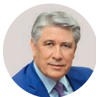
М. А. Эскиндаров Ректор Финансового университета при Правительстве РФ