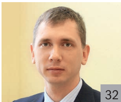
И. Н. ЗАМУРАЕВ, директор Департамента финансов Костромской области