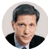
А. Д. Жуков Первый заместитель председателя Государственной думы