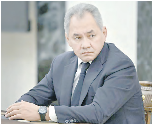
Глава военного ведомства доложил о ходе плановых манёвров

На встрече в Кремле министр обороны Российской Федерации генерал армии Сергей Шойгу доложил Президенту России Владимиру Путину о ходе учений, которые в эти дни проводятся в Вооружённых Силах: и в различных акваториях Мирового океана, и на территории ряда военных округов, и в Белоруссии. Часть из них завершена или завершится в ближайшее время.