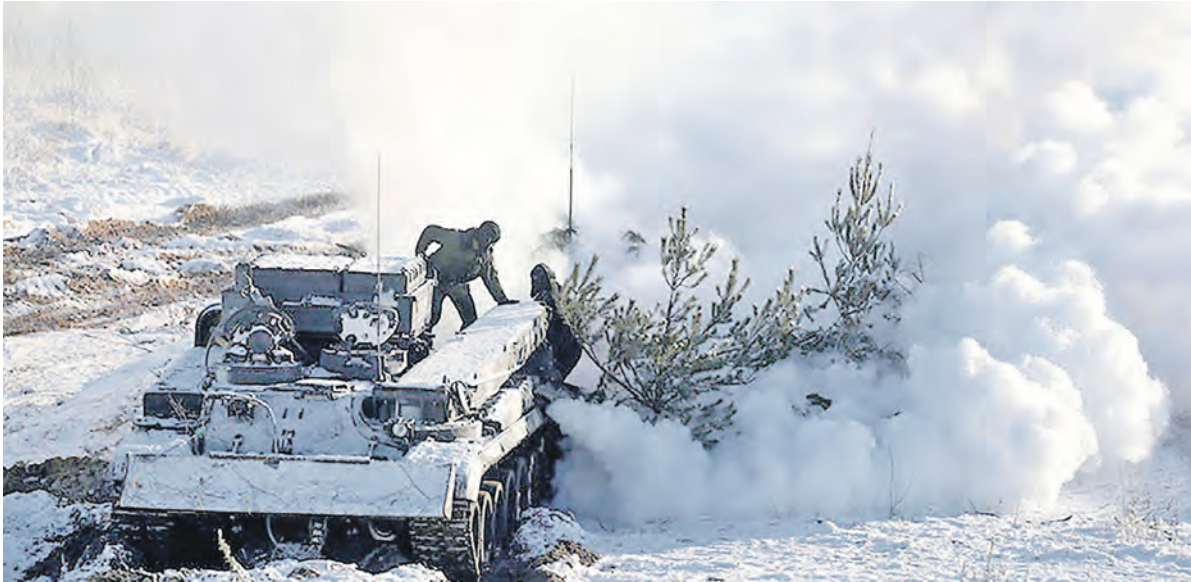
Воины подразделения РХБ защиты ставят дымовую завесу, скрывая от «противника» наши войска и пункты управления

Надо сказать (и это вовсе не новость), что российские военнослужащие, действующие на незнакомой местности, и их белорусские боевые братья в очередной раз показали всему миру, что практически способны слаженно и успешно решать самые сложные учебно-боевые задачи.