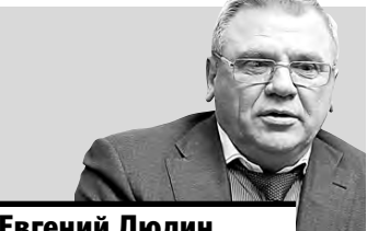
Евгений Люлин, вице-губернатор Нижегородской области