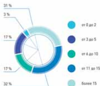
Динамика структуры компаний - участников исследования по доле инвестиций