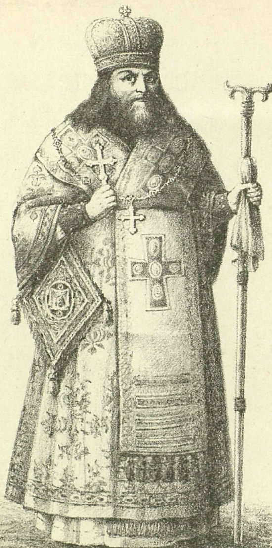
Св. Θεодосій Архіеп., Чудотв. Черниговскій.