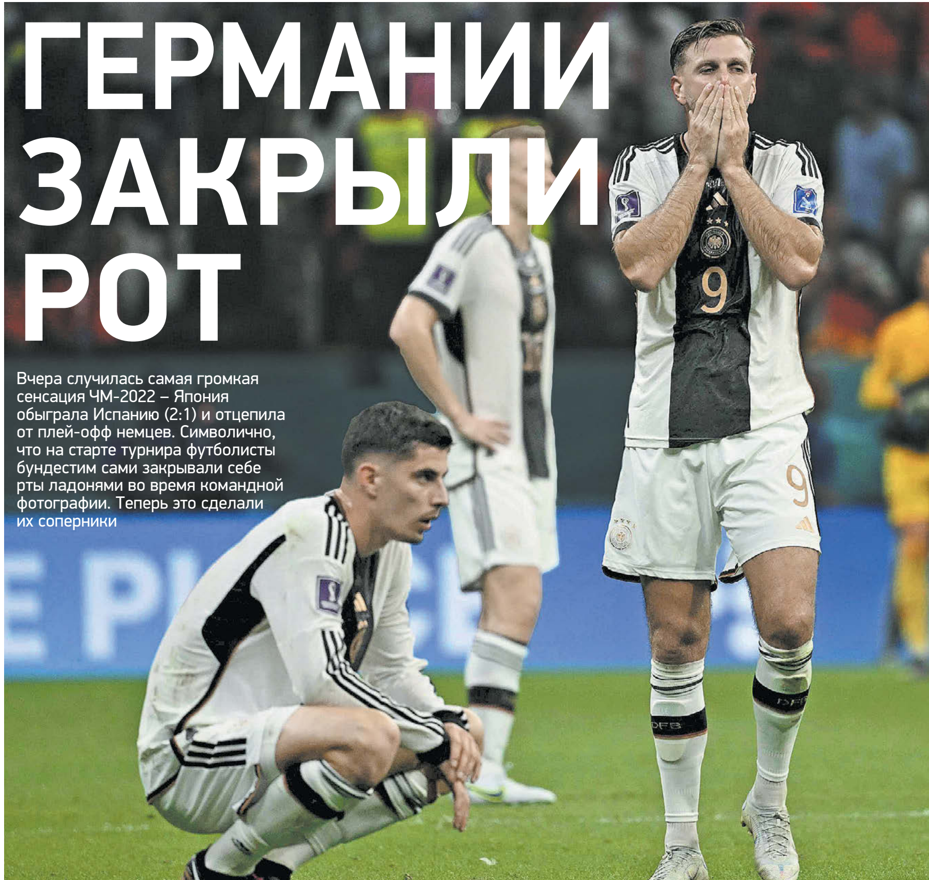
Вчера. Эль-Хаур. Коста-Рика – Германия – 2:4. Немцы уже знают результат параллельного матча

Сумасшествие! Фантастика! Что это было? В группе с двумя явными фаворитами – чемпионами мира-2010 и -2014 – и двумя явными аутсайдерами все менялось, как в калейдоскопе. От предсказуемого прохода Испании и Германии до невероятного сюжета с триумфом Японии и Коста-Рики.