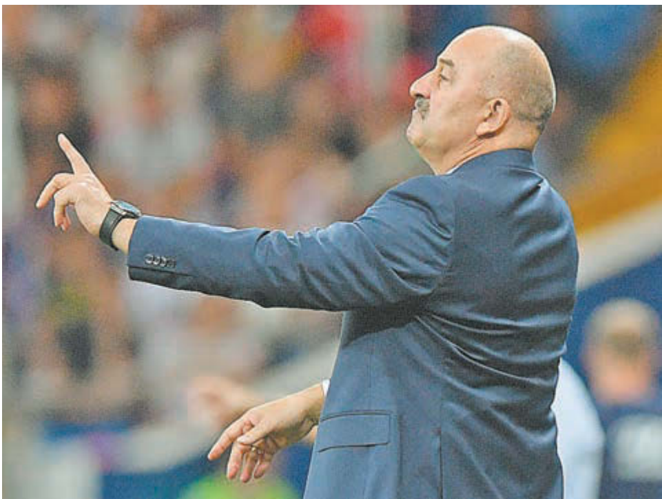
Главный тренер сборной России Станислав Черчесов