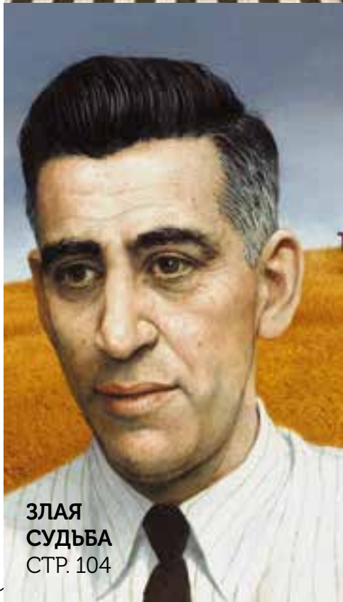
ЗЛАЯ СУДЬБА СТР. 104