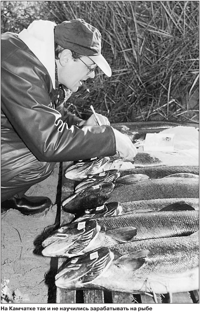
На Камчатке так и не научились зарабатывать на рыбе