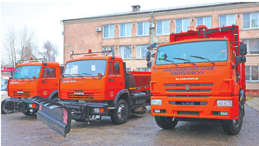
ПРАВИТЕЛЬСТВО КРАСНОЯРСКОГО КРАЯ