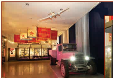
Экспозиция «Героическая оборона Ленинграда» ▲

➤ Фрагмент экспозиции, посвящённый событиям в Южной Осетии в 2008 г.