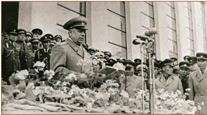
Генерал армии А.А. Епишев выступает ▲ на торжественном открытии нового здания музея 8 мая 1965 г.