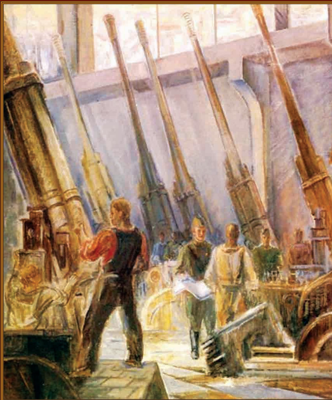
Соревнование на военном заводе Художник А.Н. Козлов, 1942 г.

19 ноября — День Ракетных войск и артиллерии