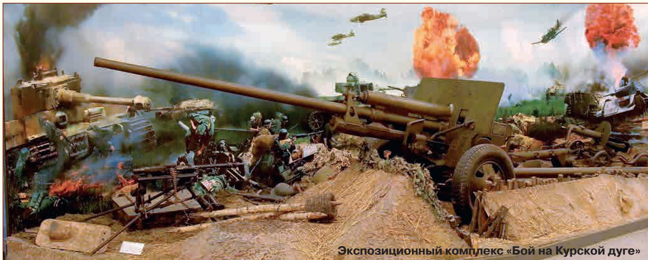
Экспозиционный комплекс «Бой на Курской дуге»