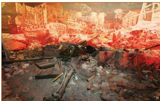
Экспозиция «Сталинградская битва». ▲ Диорама «За Волгой для нас земли нет» Художники М.И. Самсонов и А.М. Самсонов

▲ Подлинная партизанская землянка, привезённая из лесов Брянской области