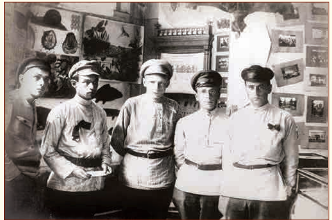
▲ Сотрудники выставки «Жизнь Красных Армии и Флота» Верхние торговые ряды (ныне ГУМ), 1920 г.