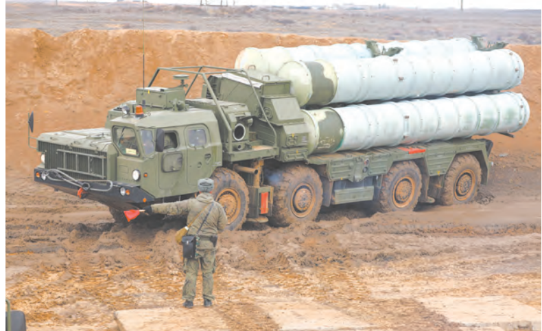
ЗРК С-400 «Триумф» предназначена для поражения всех современных и перспективных средств воздушного нападения