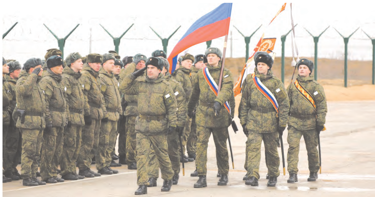
Под флагом Отечества: торжественное построение перед началом учения

В рамках первого этапа двухнедельной подготовки военнотехнические подразделения выполнили нормативы по основным дисциплинам – ракетно-стрелковой, технической, тактической и специальной подготовке. Затем прошли интенсивную теоретическую и практическую подготовку к стрельбе в специализированных учебных классах и непосредственно на зенитной ракетной технике дивизиона и командного пункта системы. На заключительном этапе