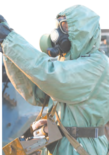
Разведка «заражённого» участка местности

Ольга ВИНУКUROVA Астраханская обл.