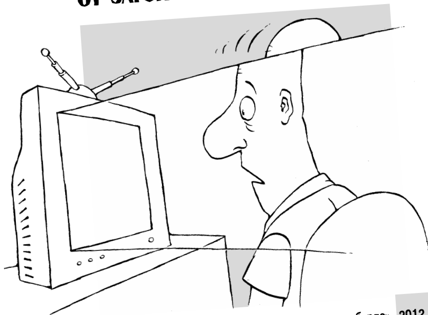
РИС. М. СМАГИНА (ЕКАТЕРИНБУРГ)