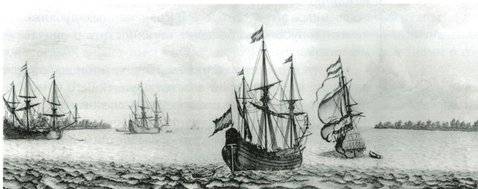
Rivier van Archangel (Peka Архангельска). Bruin C. de Reizen over Moskovie, door Persie en Indie... Amsterdam, 1711. Между с. 4 и 5

Хранящиеся в архивах источники XVIII в. подробно отражают историю застройки и планировки города, а также строительную судьбу многих па-