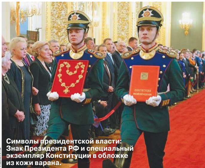
Символы президентской власти: Знак Президента РФ и специальный экземпляр Конституции в обложке из кожи варана.