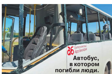
Автобус, в котором погибли люди.