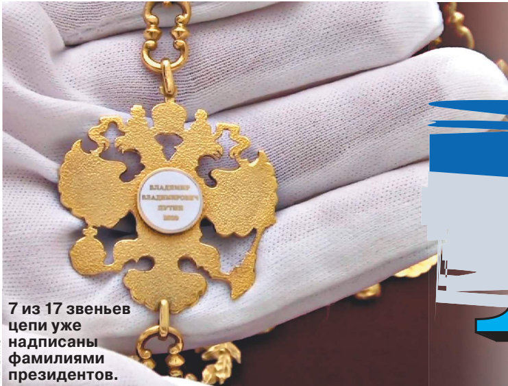
7 из 17 звеньев цепи уже надписаны фамилиями президентов.