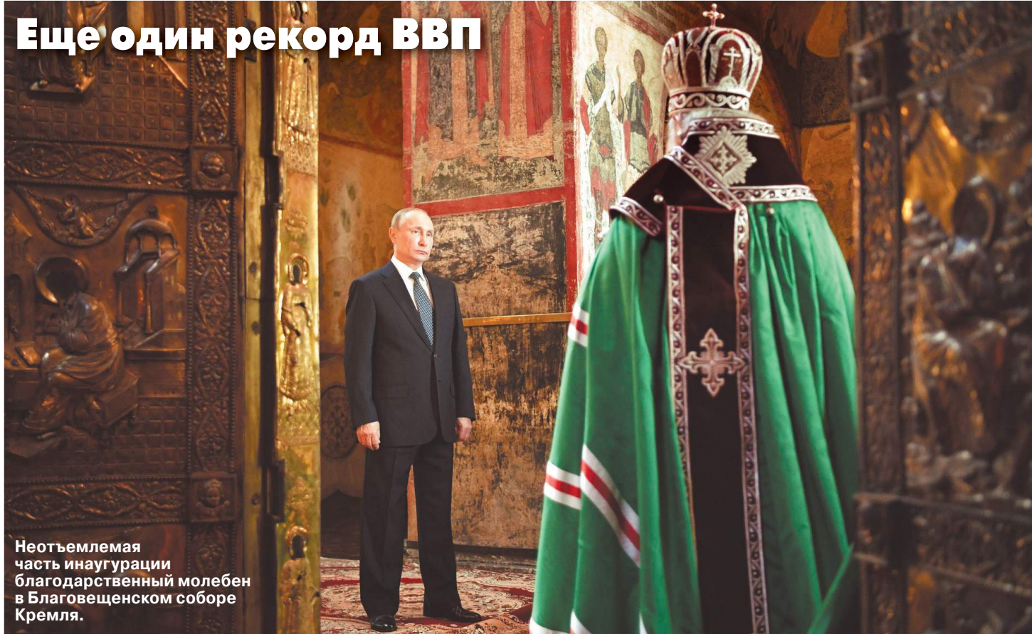
Неотъемлемая часть инаугурации: благодарственный молебен в Благовещенском соборе Кремля.

К инаугурации Владимира Путина 7 мая готовили не только Большой Кремлевский дворец, Красное крыльцо, на которое после принесения присяги выйдет глава государства, и домовый храм