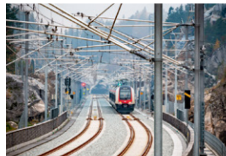
Обложка Линия Vestfoldbanen (Драммен — Эйдангер) в Норвегии