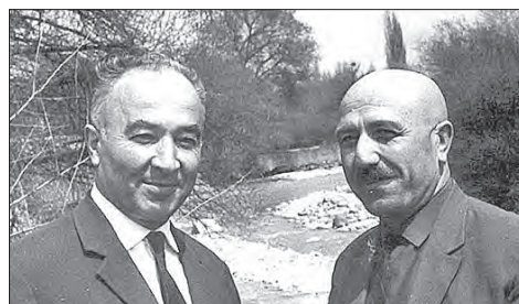
Алим Кешоков и Кайсын Кулиев

Именно это трепетное отношение к понятию «честь», умение чувствовать душу мира и остро, болезненно сострадать человеческим бедам сделало Кайсына Кулиева поистине народным поэтом.