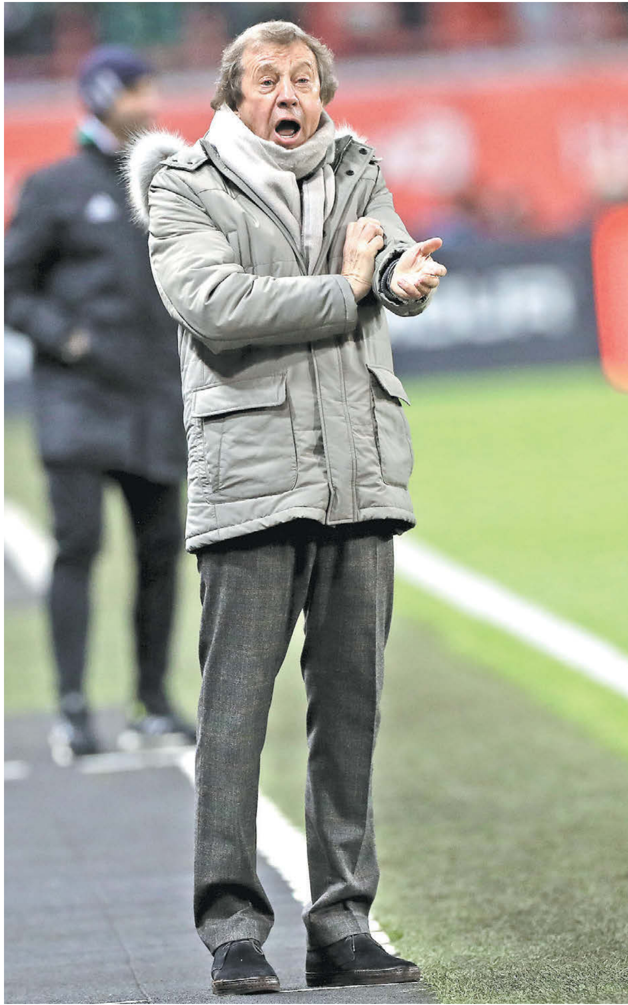
Вопрос нового контракта Юрия Семина с «Локомотивом» станет одним из главных в РПЛ будущим летом