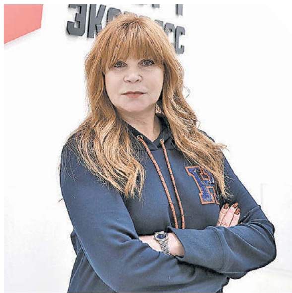
Александр Федоров «СЭ» / Canon EOS-1DX Mark II