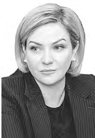
Ольга Любимова, министр культуры РФ:

Компенсация части затрат, понесенных кинопроизводителями в крае, стали выплачивать в 2021 году. Тогда в региональный департамент инвестиций и развития малого и среднего предпринимательства на новую субсидию поступило десять заявок. По результатам отбора ее получили пять компаний, снявшие шесть кинокартин на общую сумму 19,16 миллиона рублей. В 2022 году поступило 22 заявки. 38,4 миллиона получили десять компаний на 19 кинокартин. Местных контрагентов, привлеченных к процессу, стало больше: если в позапрошлом году их было 58, то в 2022 году уже 242. ●