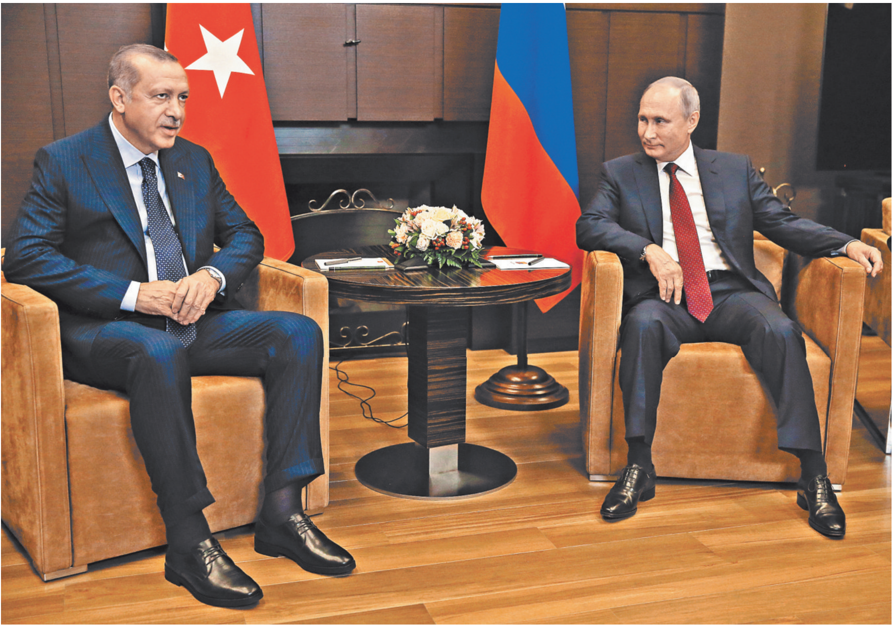
Вчера в сочинской резиденции Бочаров Ручей прошла встреча Владимира Путина с президентом Турции Реджепом Эрдоганом. Как пояснил журналистам перед вылетом в Сочи пресс-секретарь президента РФ Дмитрий Песков, встреча двух лидеров связана с ситуацией в сирийском Идлибе, обстановка вокруг которого остается острой.

Напомним, идею о дактилоскопической регистрации всех въезжающих в страну мигрантов ранее неоднократно озвучивал председатель Следственного комитета России Александр Бастрыкин. По его словам, такая мера значительно ускорит работу экспертов-криминалистов, а значит, и сроки расследования многих уголовных дел, в которых замешаны приезжие.