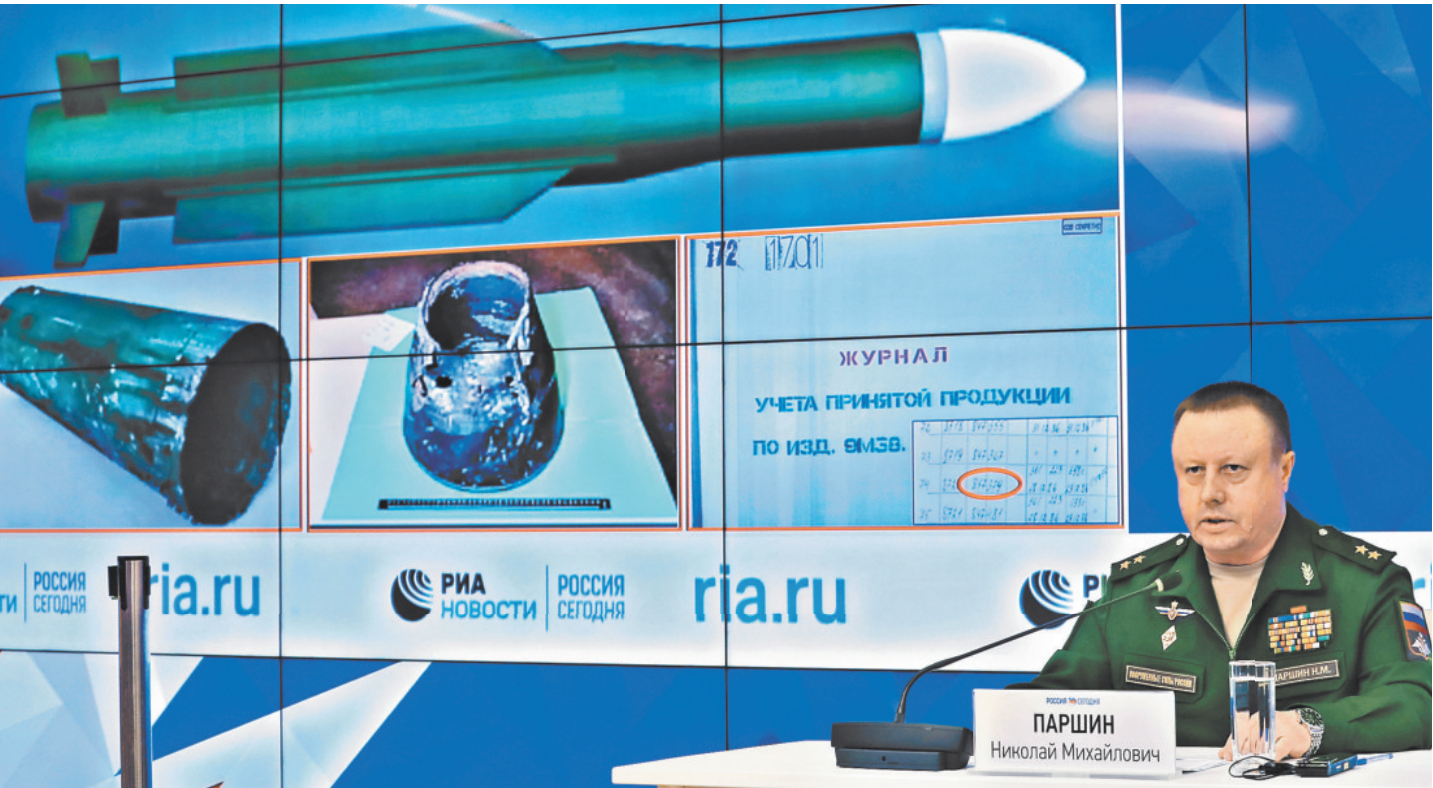
Начальник главного ракетно-артиллерийского управления Вооруженных сил России Николай Паршин раскрыл место и время производства ракеты, которой был сбит малайзийский «Боинг», а также украинскую часть, где она стояла на вооружении.