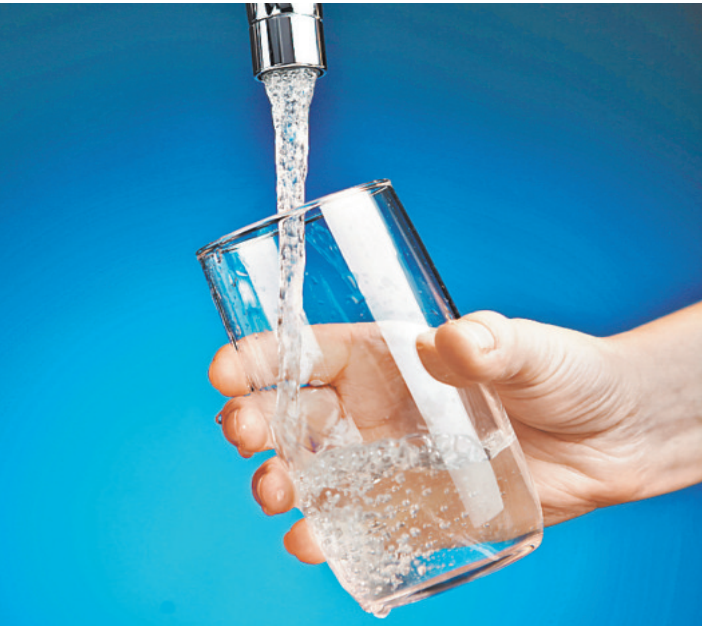
Свыше 8 миллионов человек пьют воду, качество которой не соответствует нормам.