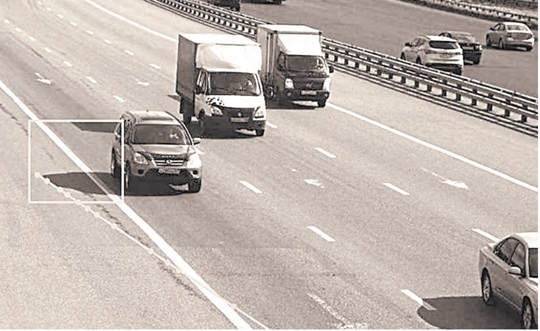
Иногда камеры тень от автомобиля идентифицируют как выезд на выделенную полосу, и водителю приходит штраф.

Однако он применяется, и автоводители массово получают штрафы. «Аппарат предназначен для наружного наблюдения и фиксации времени, а его используют как систему автоматической фотовидеофиксации», говорит депутат.