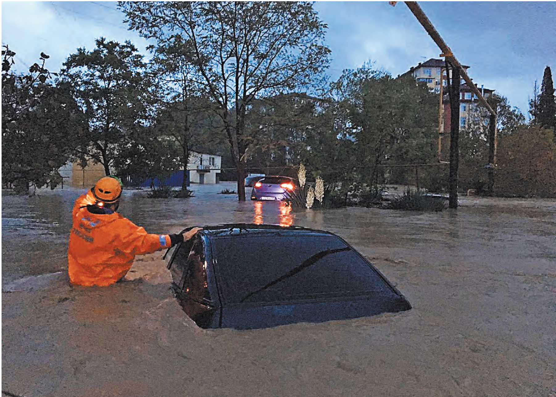
ЮРИЙ И РЕГИОНАЛЬНЫЙ ПОСКОМОСТАТОВЫЙ ОТРИД МНС РФ

Ольга Максимова, «Российская газета», Краснодарский край