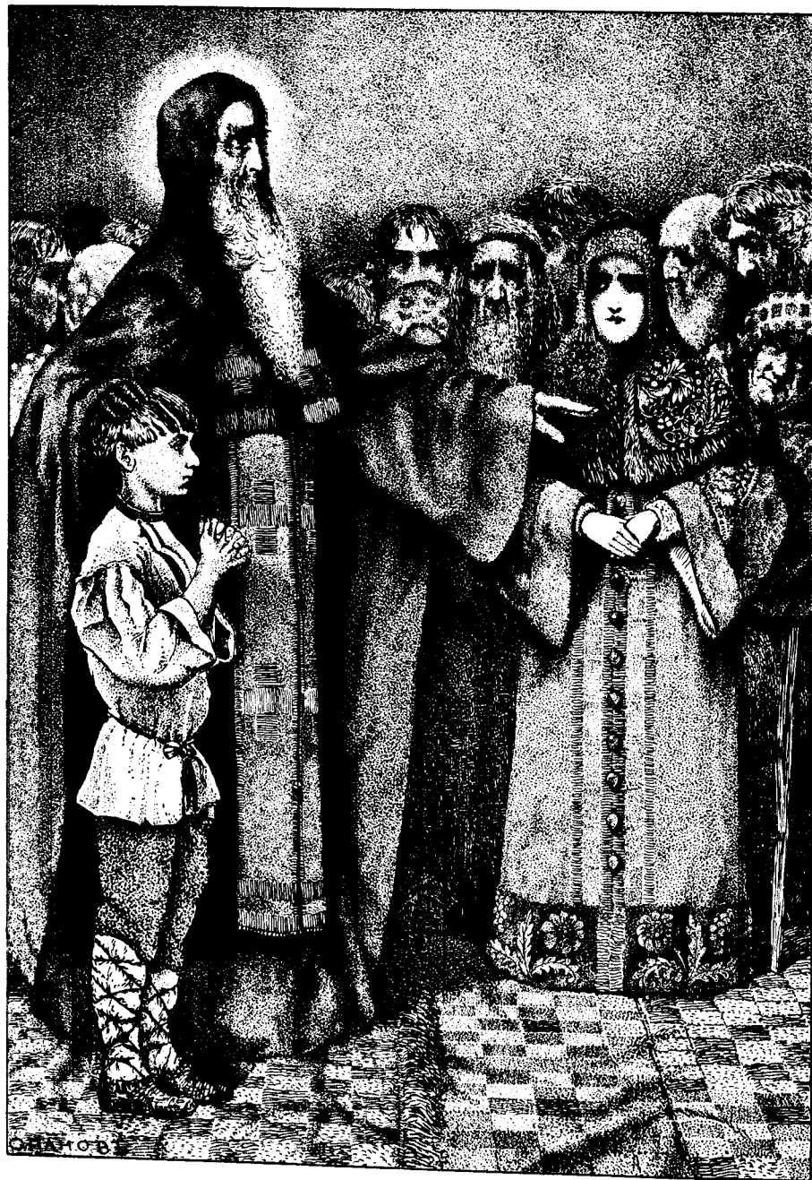
Отрскъ Вареломей и старецъ-пресвитеръ въ домъ боярина Кирилла. Ориг. рис. С. И. Панова.