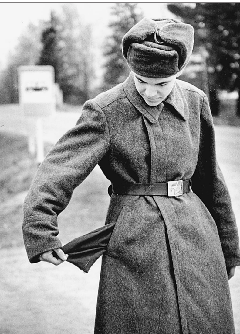
17 января. Солдат на службе

Поэтому России по политическим и экономическим причинам необходимо сохранить позиции одного из мировых лидеров в сфере производства высокотехнологичных вооружений. Именно такое оружие можно продавать за рубежом с максимальной выгодой.