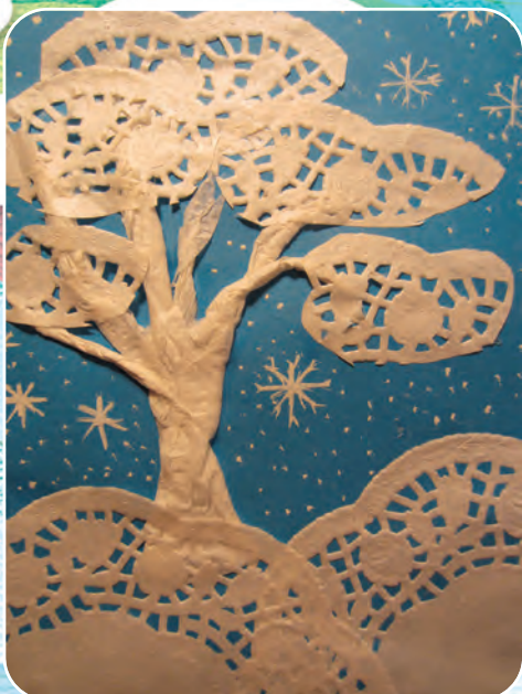
Зимнее дерево из кружевной салфетки