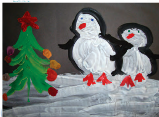
Пингвины на льдине