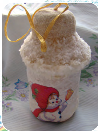
Домик Деда Мороза