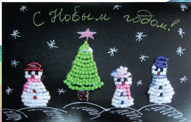
Открытка «С Новым годом!»