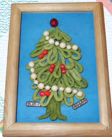
Елочка зеленая... соленая!