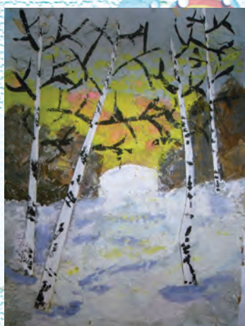
Пейзаж на листьях