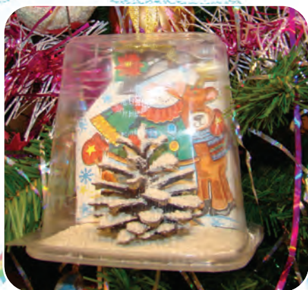
Подвеска с елочкой