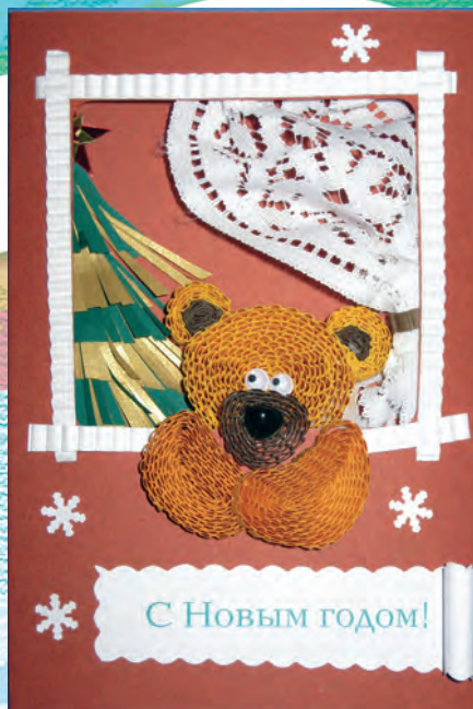
Открытка с медведем