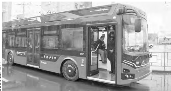
Троллейбус «Адмирал» — самая современная модель на российском рынке.

Ивановская область получила троллейбусы на условиях льготного лизинга за 640 миллионов рублей. Из этой суммы 378 миллионов покрывала федеральная субсидия, 261 миллион должен добавить региональный бюджет в течение пяти лет.