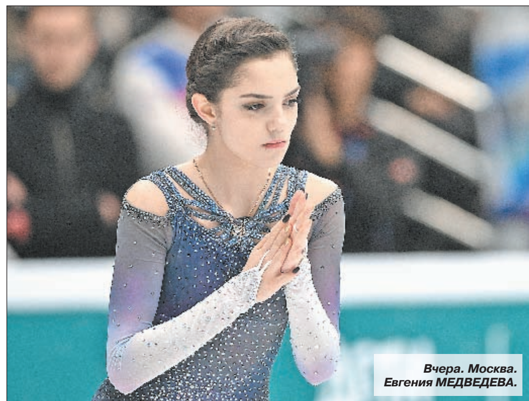
Вчера. Москва. Евгения МЕДВЕДЕВА.