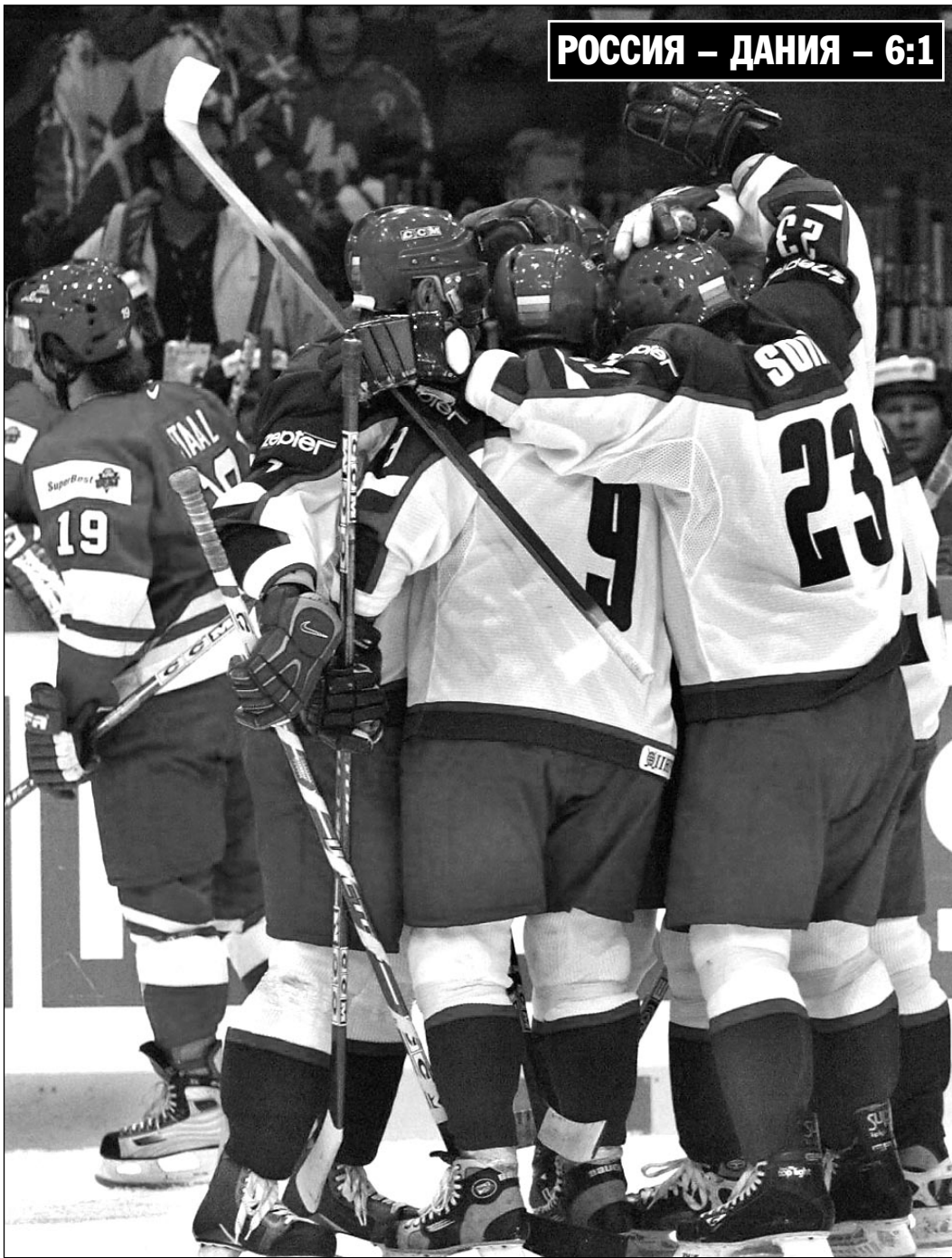
Вчера, Тампере. Ice Hall. Россия - Дания - 6:1. Россияне установили рекорд чемпионата, забросив во втором периоде пять шайб за 7 минут 11 секунд.