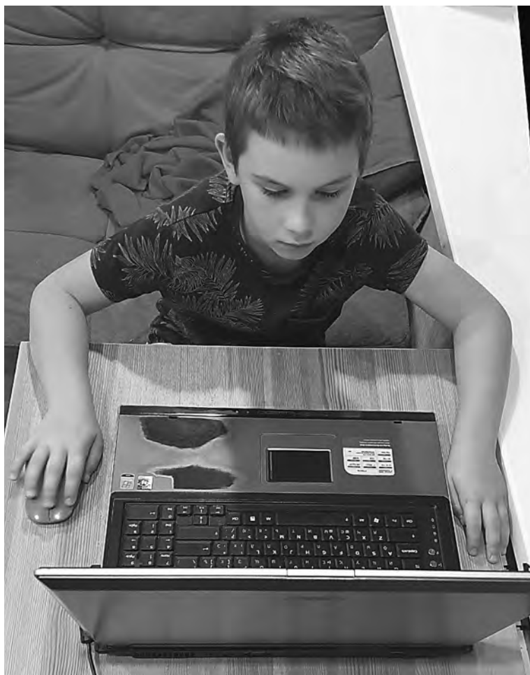
Пока в Самаре дистанционно учатся только школьники среднего и старшего звена.

Мнения саратовцев по поводу обоснованности возвращения очного образования разделились. Часть родителей и раньше выступали за возвращение детей в школы, около ста человек даже обратились в прокуратуру. В то же время теперь начался сбор подписей за сохранение дистанционных занятий до конца полугодия.