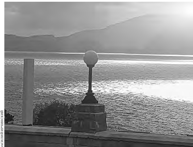
На реконструкцию волжского променада будет направлено первым траншем более 600 миллионов рублей.