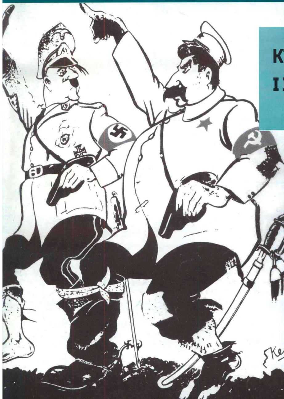
Английская карикатура 1939 г.