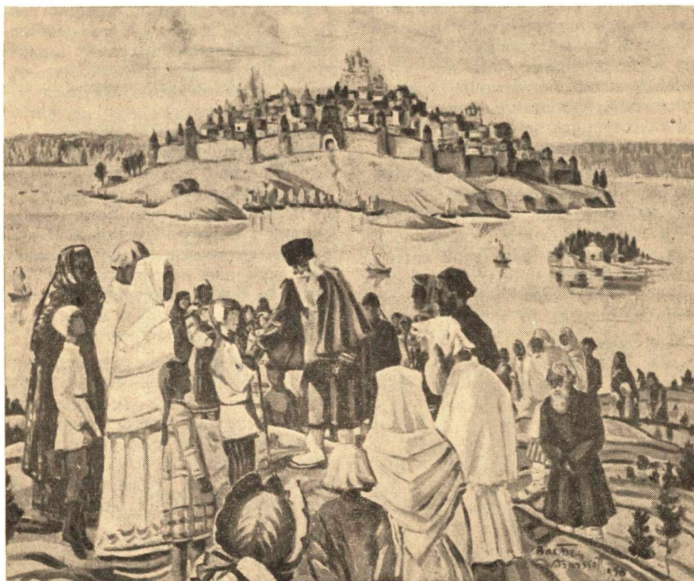
СВЯТО - ДРЕВНЯЯ РУСЬ С КАРТИНЫ ХУДОЖНИКА ВАСИЛИЯ БАРСОВА

Сердечно поздравляем всех читателей, сотрудников и друзей нашего еженедельника в России и зарубежом со Светлым Праздником Воскресения Господа нашего Иисуса Христа!