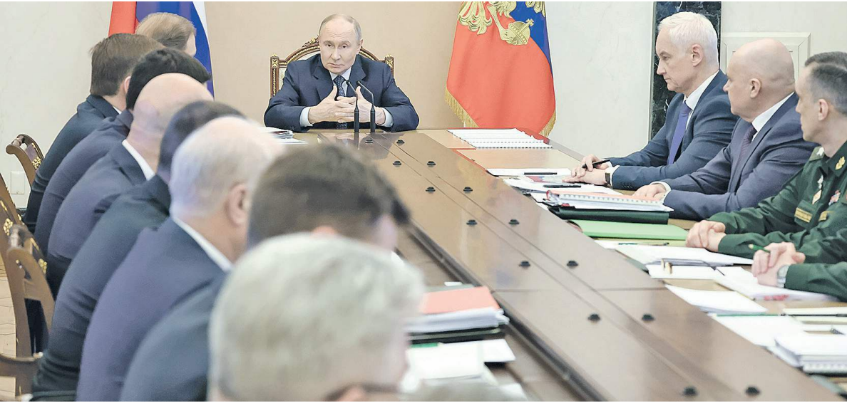
Под неослабным контролем Верховного Главнокомандующего.

Верховный Главнокомандующий поставил задачу обеспечить их максимально быстрое и качественное развитие