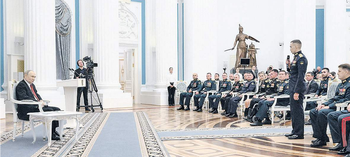
Вот она, настоящая элита страны!