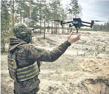
Современная война — это война беспилотников.

летии XXI века, — отметил Владимир Путин. Он напомнил, что в апреле обсуждались вопросы наращивания объёмов поставок и повышения эффективности применения вооружений и техники для решения задач специальной военной операции. Намеченные тогда меры реализуются, однако эти меры носят, по сути, оперативный характер и выполняются в кратчайшие сроки, что называется, здесь и сейчас, в режиме реального времени, исходя из текущих нужд, — сказал глава государства. — Сегодня же наша задача — сформировать новую долгосрочную программу по всему комплексу систем и образцов вооружений, в том числе и прежде всего, конечно, перспективных. Максимально использовать для этого опыт специальной военной