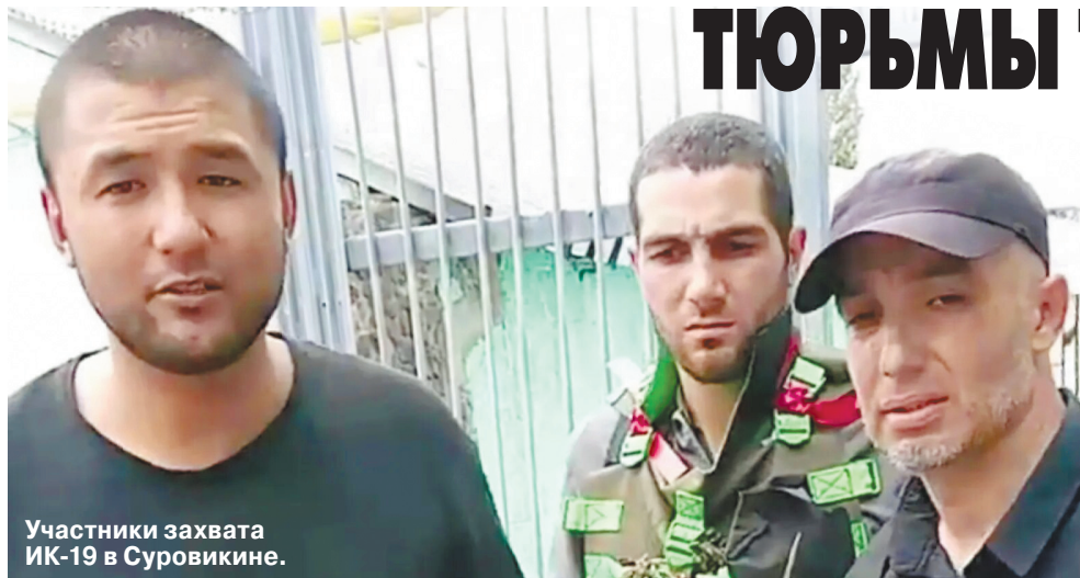
Участники захвата ИК-19 в Суровикине.