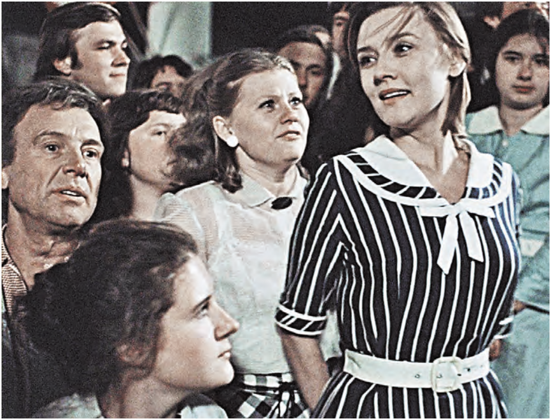
Вера Алентова создала образ, который копировали во всем мире.

— С творчеством немного разобрались. Теперь несколько слов о грядущем юбилее: как будете отмечать? ВЛАДИМИР МЕНШОВ: С огромным удовольствием сбежал бы. Но сбежать надо было в сентябре августа и вернуться в сентябре. А сейчас уже столько завязано на этом. Кто-то ждет интервью. Кто-то ждет подарок предпенси, зовут на эту передачу, на ту. Придется праздновать.