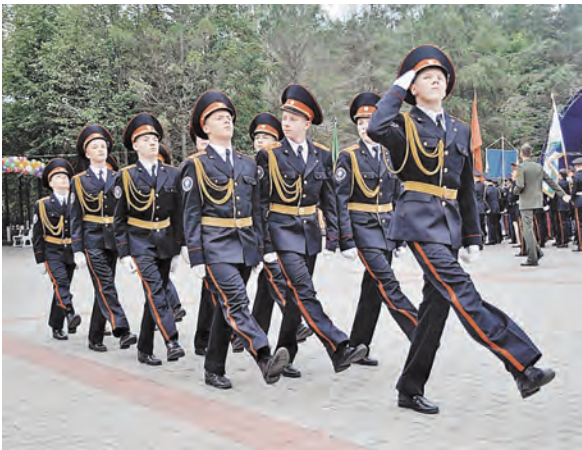
Воспитание патриотизма — одна из важнейших задач молодежной политики Союзного государства.

Отличной строевой подготовкой выделяется «коробка» воспитанников морских классов Гатчинской школы-интерната.