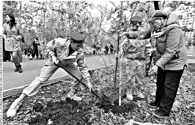
Взрослые и дети вместе высадили 40 вечнозеленых лиственниц.