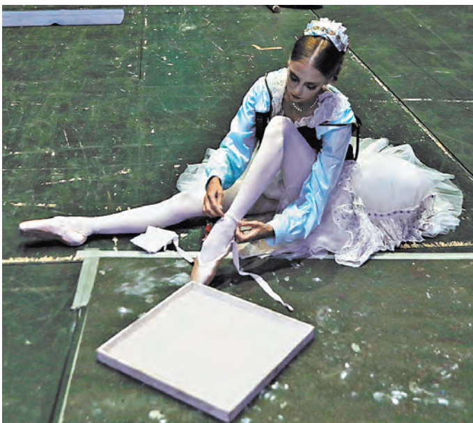
АЛЕКСАНДР ДЕМЯНЧУК / ТАСС

Мариинский театр первым в стране прервал затянувшийся антракт и открыл свои залы для публики