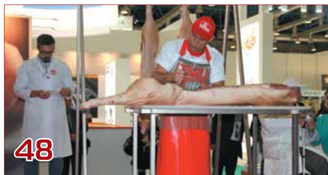
Конкурс: высокий класс демонстрируют обвальщики