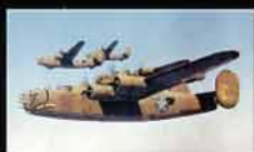
СТРАТЕГИЧЕСКОЕ ВОЗДУШНОЕ НАСТУПЛЕНИЕ