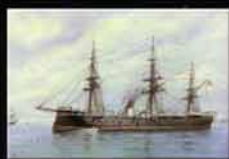
БРОНЕНОСЦЫ АРМАДЫ ЭСПАНЬОЛЫ