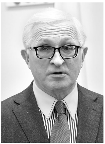
Александр Шохин, президент РСПП:

— На каких условиях власти хотят привлечь частный бизнес к реализации нацпроектов? Главный пункт — сохранение базовых регуляторных и фискальных налоговых условий на весь срок реализации проекта, включая разумные сроки его окупаемости. Понятно, что правительство не может обещать неизменность условий только для инвесторов, но тогда должны быть оговорены механизмы компенсации потерь, связанных с ухудшением ведения инвестиционной деятельности в период реализации нацпроектов.